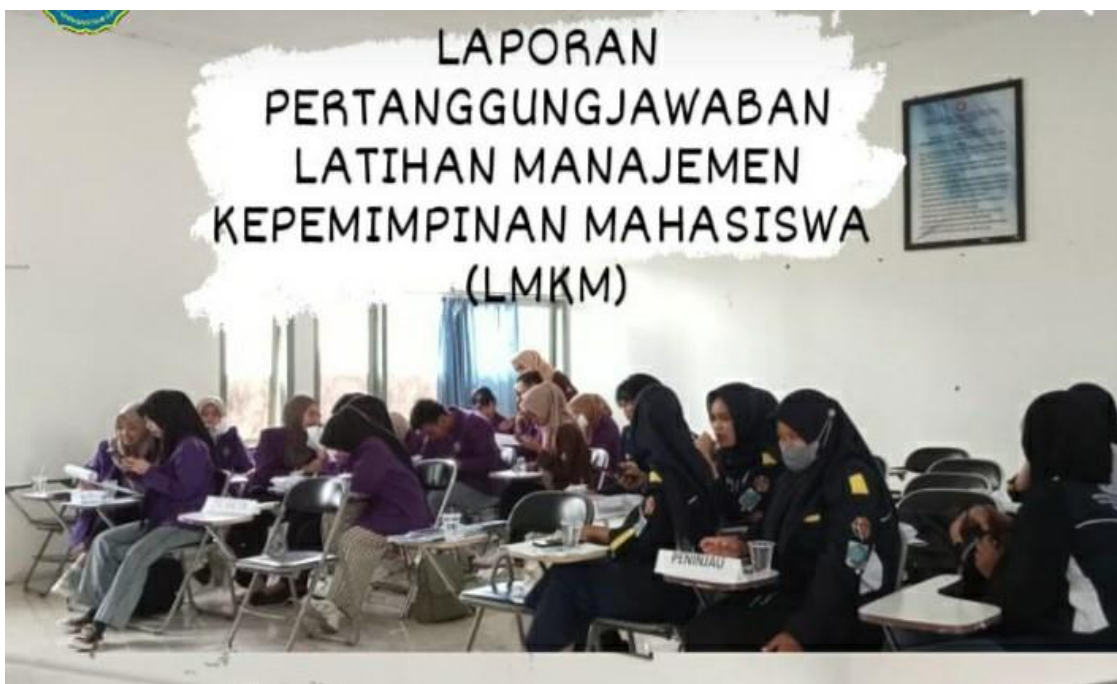
(Kegiatan: Laporan Pertanggungjawaban kegiatan LMKM )