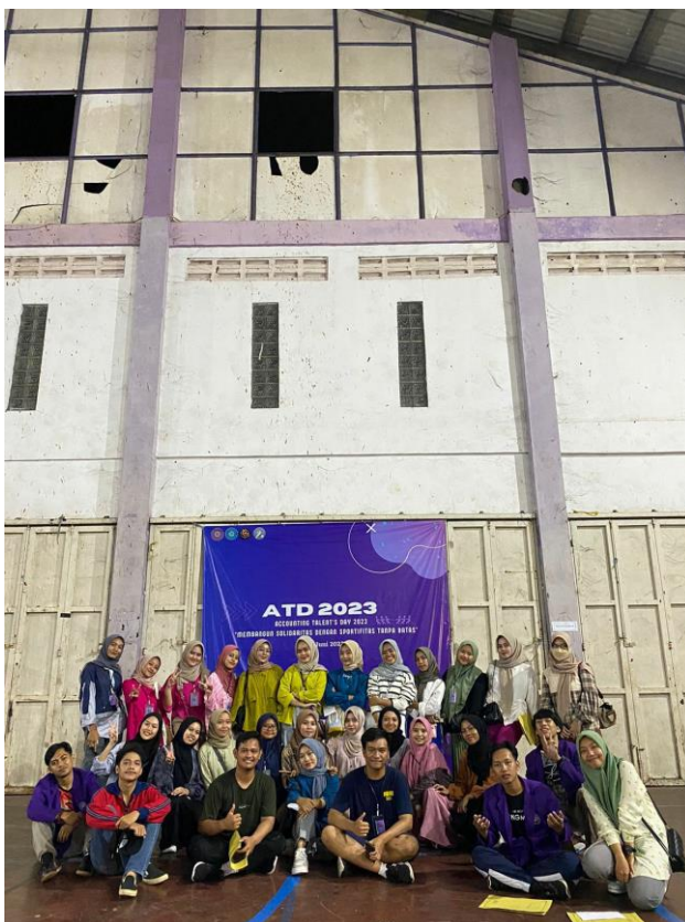
(Kegiatan: pengawasan terhadap program HIMADIKSI dalam program Accounting Talent day)