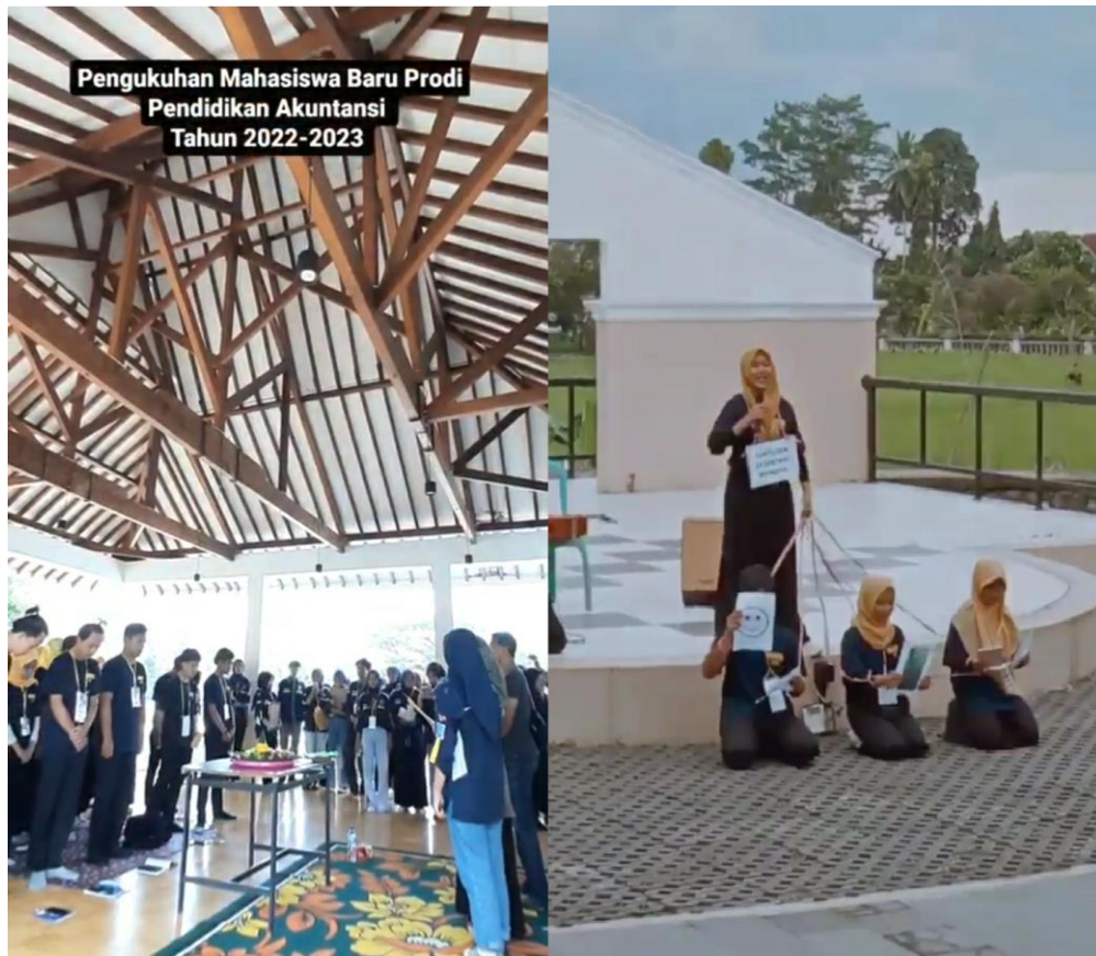
(Kegiatan: Pengawasan terhadap HIMA pada jalannya acara INAUGURASI)