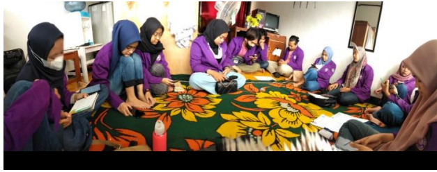
(Kegiatan: Rapat Bulanan bersama Himpunan)