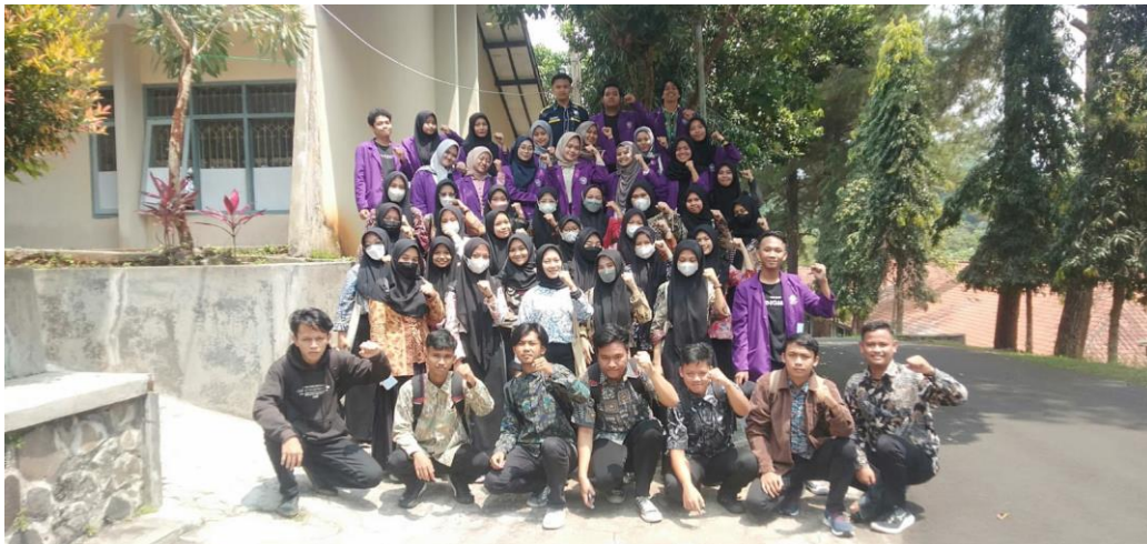
(Kegiatan: Pengawasan terhadap HIMA pada jalannya acara BAMBA - 26 September 2022) Hari Pertama