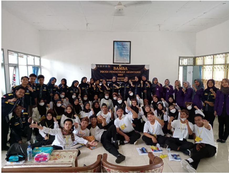
(Kegiatan: Pengawasan terhadap HIMA pada jalannya acara BAMBA - 27 September 2022) Hari Kedua