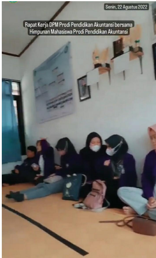
(Kegiatan: RAKER [Rapat Kerja] HIMA dan DPM Pendidikan - 22 Agustus 2022)