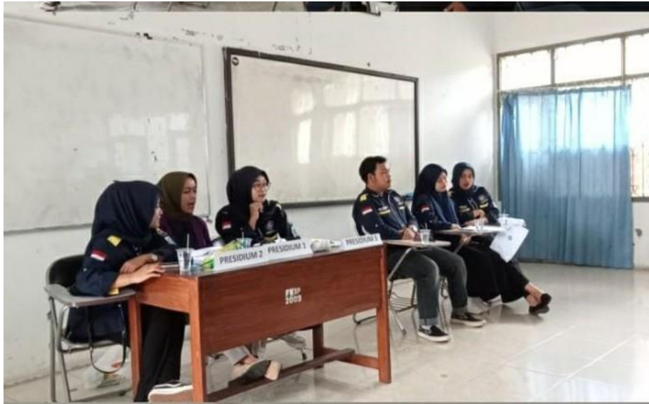
(Kegiatan: Laporan Pertanggungjawaban HIMADIKSI pada Triwulan 1 pada bulan Desember)