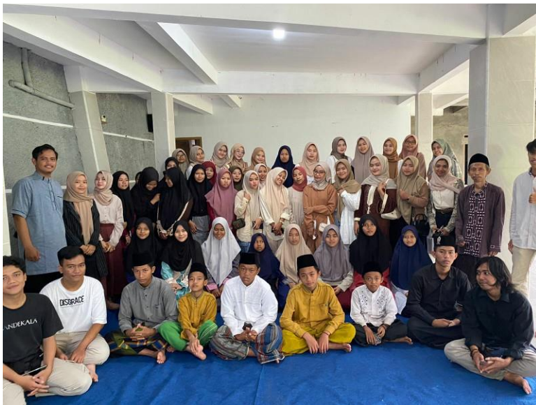
(Kegiatan: pengawasan terhadap program kerja Hima pada kegiatan Baksos di Yayasan Yatim - 7 April 2023)