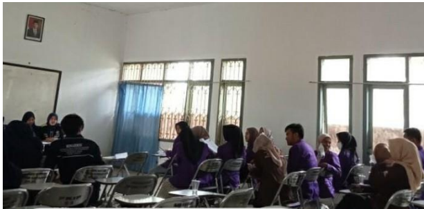
(Kegiatan : Laporan Pertanggungjawaban Triwulan 2)